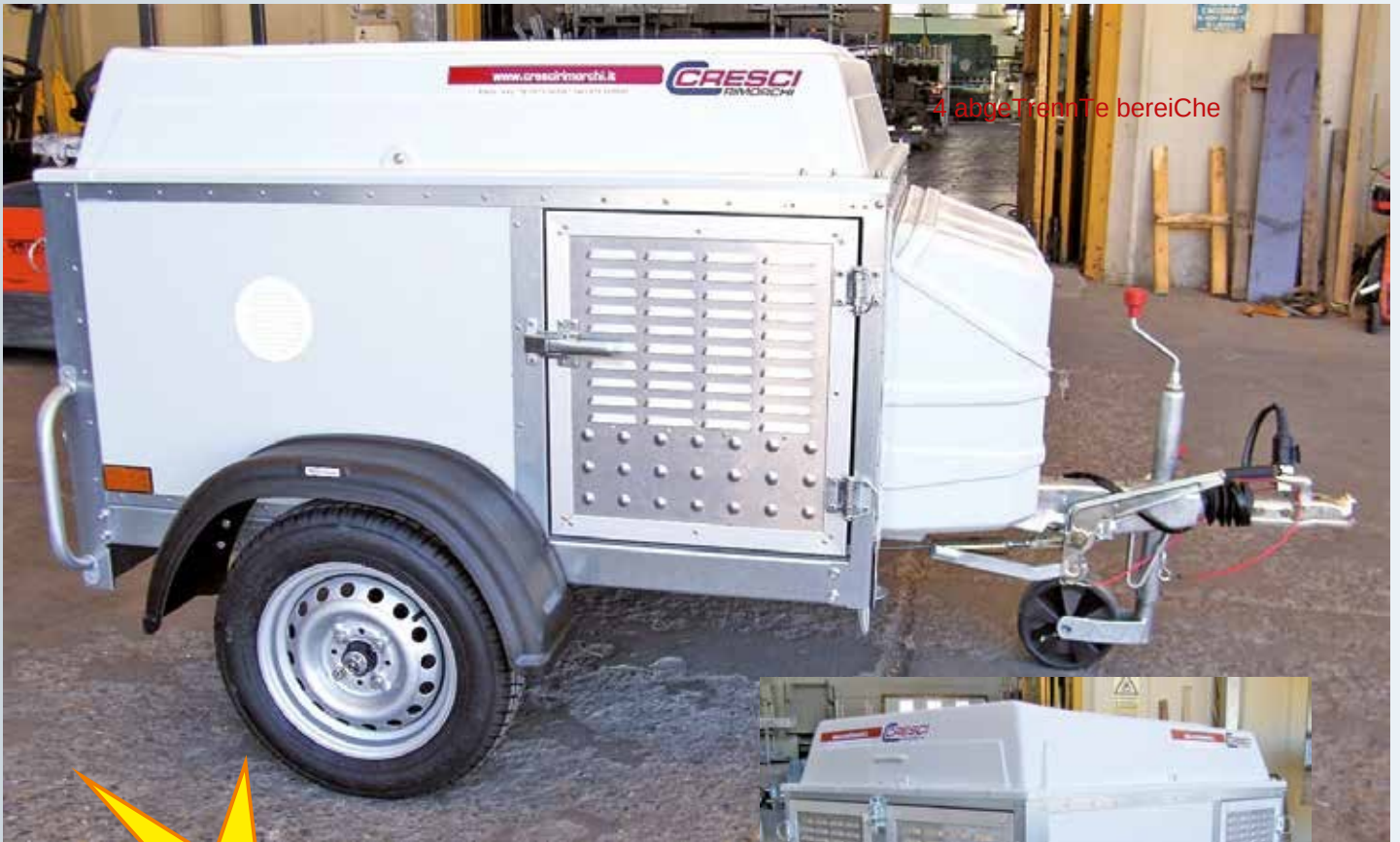
4 abgetrennte Bereiche